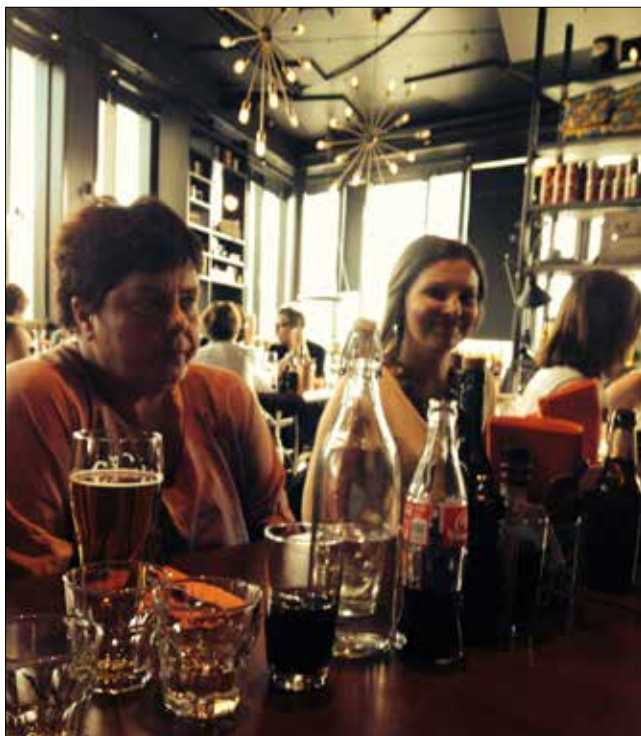
Festmiddag i Trondheim.