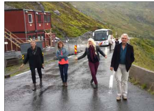
På Gaularfjellet var det tid for lufting av korpsmusikantar på veg heim frå øvingshelg på Kviknes hotell i Balestrand.

Korpset øver i aulaen på Firda vidaregåande skule torsdagar frå 1915 til 2200.