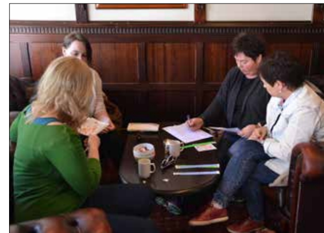
Papirarbeid i foajeen på hotellet i Trondheim.

Bare Neccessities Always Look On The Bright Side Of Life Daisy Dream A little Dream Of Me Godnatt, blues Se, nu tittar lilla solen in igen Sønnavindsvalsen The Cantina Band Frå «Super Hits for marching band» (hefte) Frå «Alles zur Stimmung» (tyroler-hefte)