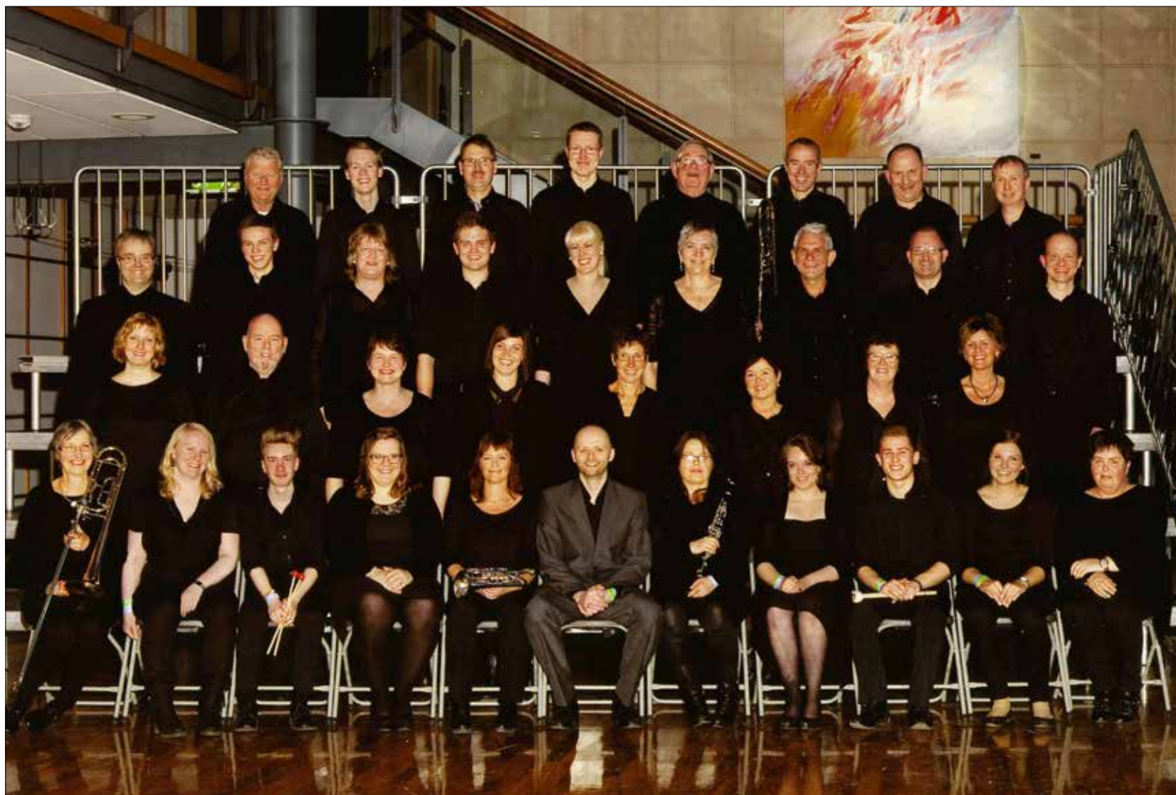
NM for janitsjarkorps i Trondheim 4. april 2014.