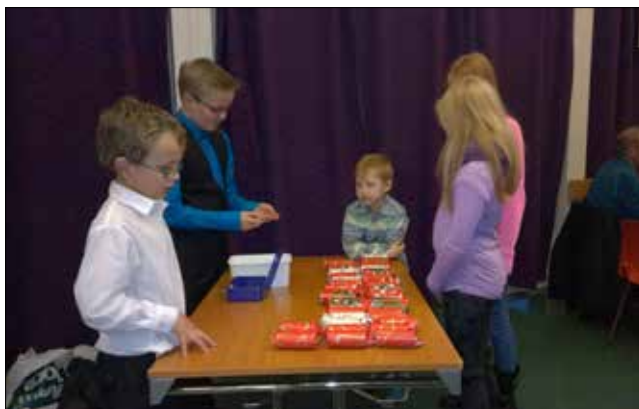
Og ved godis-bordet på julebasaren sørget yngre krefter for at salet alltid går godt.