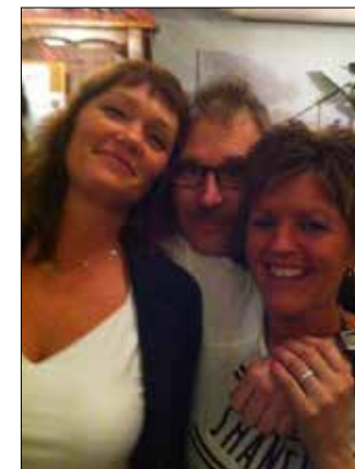
Leiarvervet i Gloppen janitsjar har sine lyse sider.