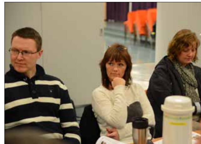
Frå årsmøtet i entreen i aulaen på Firda vgs.