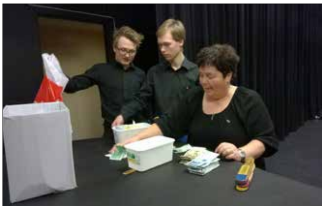
Lotteritiltaka korpset har satte nye rekordar i året som gjekk, og november runda hovudlotteri og julebasaren ei sekssifra omseting.

Sandane, 5. februar 2015, Heidi Fure Klausen (sign), Didrik Eide (sign)