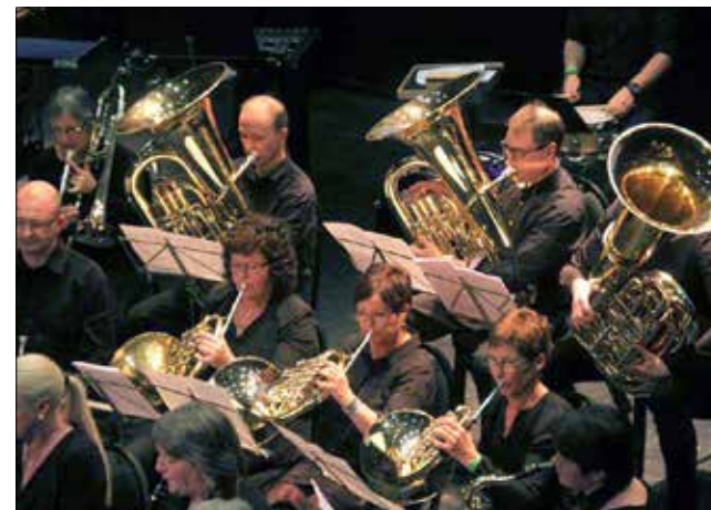
Kjende folk i kjent korps i NMF sin biletserie på nett frå NM i Trondheim.